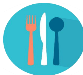
Mensa – Mittagessen